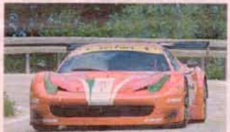
Lucio Peruggini in testa alle Gran Turismo con la Ferrari 458 GT3