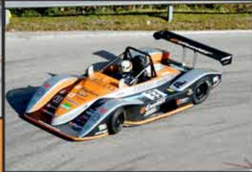
8-10-2017 Pedavena New Record: 3.43,30