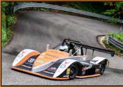
21-5-2017 Sarnano New Record: 4.18,55