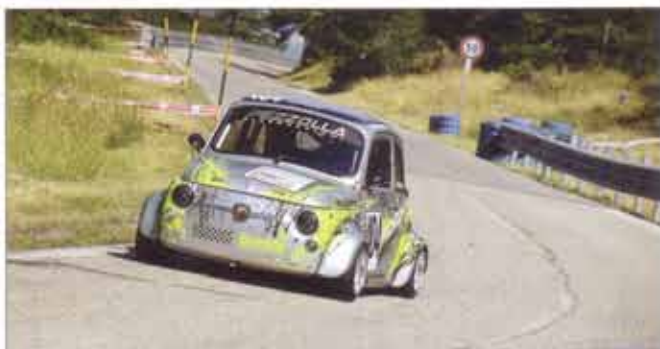
Sopra: Oronzo Montanaro (Fiat 500) Sotto: Ivan Pezzolla (Osella Pa21JrB Bmw).