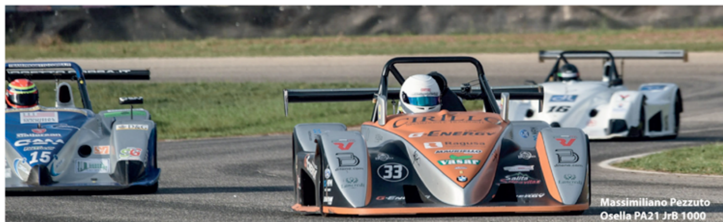
Massimiliano Pezzuto Osella PA21 JrB 1000