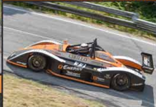
20-8-2017 Gubbio New Record: 1.44,31