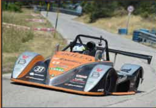
26-6-2017 Ascoli New Record: 2.26,19