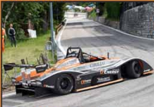
2-7-2017 Trento/Bondone New Record: 10.00,33