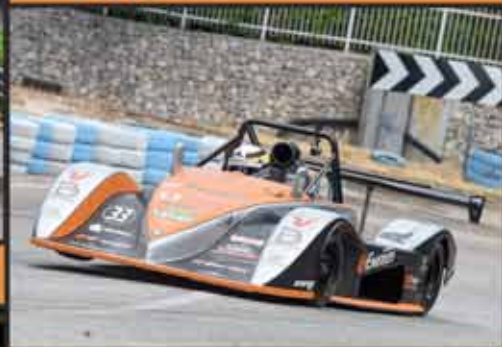
16-7-2017 Fasano/Selva New Record: 2.19,13