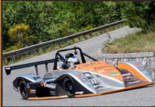
12-6-2017 Morano Calabro New Record: 3.04,05