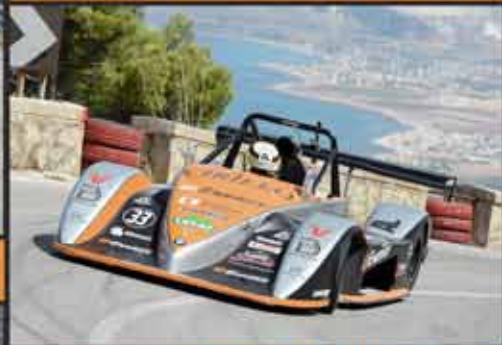
17-9-2017 Monte Erice New Record: 3.06,57